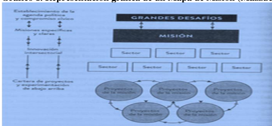
Gráfico 1. Representación gráfica de un Mapa de Misión (Mazzucato, 2021)

En esta representación gráfica, Mazzucato, sitúa los grandes desafíos actuales como la referencia obligada para cualquier misión. En este lugar suele situar siempre a los Objetivos de desarrollo sostenible (ONU, 2030), la razón que expone es la siguiente